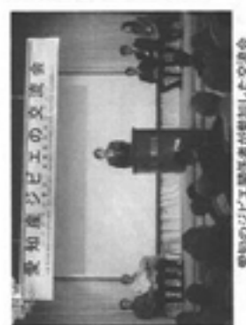
愛知のジビエ関係者が参加した交流会

会場には野生鳥獣による農作物被害の実態、シカの生態と対策などの解説パネルや、調理したイノシシにストレスを与えず肉質の劣化を防ぎ、ジビエ料理に適した豚の豚骨などを展示。イノシシ、シカ捕獲の実態についての講演。愛知県環境情報推進課環境課長職員による野生鳥獣肉衛生ガイドラインの説明などが行われた。後、ジビエ料理の試食をしながら参加者間の交流が持たれた。