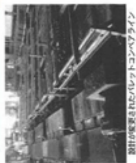
設計が実装されたバレットコンベアライン

コスト削減要求や、材料価格、電気使用量の高騰による製造原価の上昇、海外との価格競争、労働環境の問題などにより後継者不足で廃業を余儀なくされる会社が多い。その中で、同社は現在名古屋市内で唯一、大手工作機械メーカー向けに約5千種類の小物鋳物部品(100g以下、100g以上)を製造する。