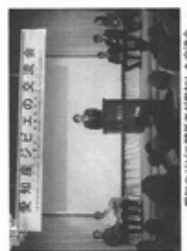
愛知のジビエ関係者が参加した交流会

会場には野生鳥獣による農作物被害の実態、シカの生態と対策などの解説パネルや、調理したイノシシにストレスを与えず肉質の劣化を防ぎ、ジビエ料理に適した豚の豚骨などを展示。イノシシ、シカ捕獲の実態についての講演。愛知県環境情報推進課環境課長職員による野生鳥獣肉衛生ガイドラインの説明などが行われた。後、ジビエ料理の試食をしながら参加者同士の交流が持たれた。