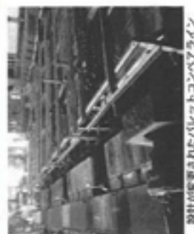
設計が変更されたパレットコンベアライン

コスト削減要求や、材料価格、電気使用量の高騰による製造原価の上昇、海外との価格競争、労働環境の問題などにより後継者不足で廃業を余儀なくされる会社が多い。その中で、同社は現在名古屋市内で唯一、大手工作機械メーカー向けに約5千種類の小物鋳物部品(100g〜1000g)を製造する。